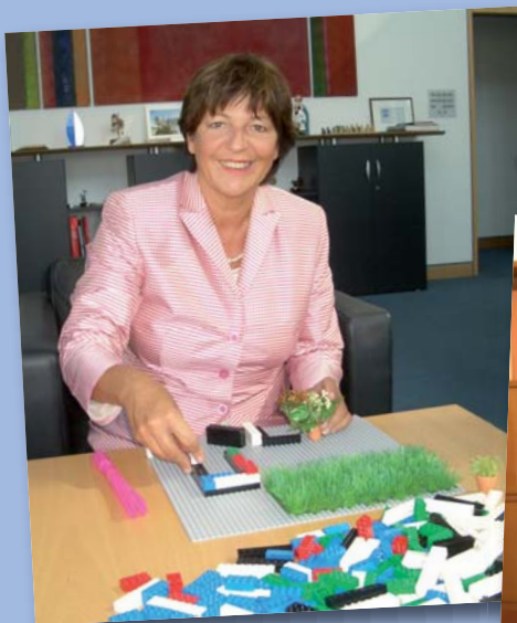
Bundesministerin Ulla Schmidt mit ihrem Baumaterial